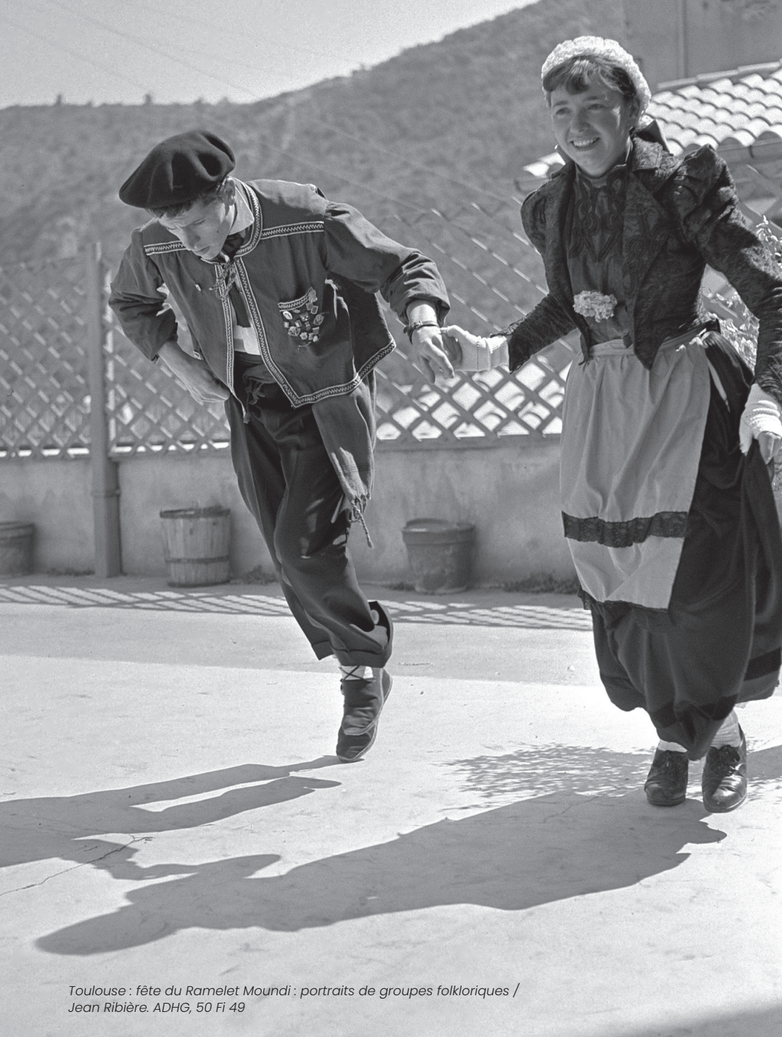
Toulouse : fête du Ramelet Moundi : portraits de groupes folkloriques / Jean Ribière. ADHG, 50 Fi 49