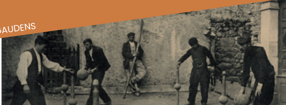
Fonds Labouche frères. ADHG, 26 FI PYRÉNÉES 363

DIMANCHE 17 SEPTEMBRE › 10h-13h / 14h-19h