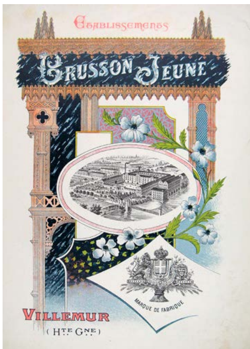
Document de présentation extrait du fonds Brusson Jeune, ADHG, 98 J.

Réservation > En ligne sur la plateforme : https://formulaires.services.haute-garonne.fr/archives-departementales/inscription-activites-culturelles/