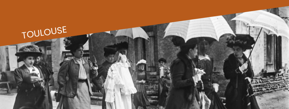
Dans une rue de La Bastide-de-Besplas (Ariège), en avril 1909 : groupe de femmes, réunion de famille à l'occasion d'un baptême, ADHG, 90 Fi 253