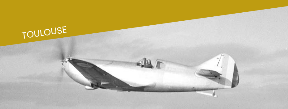
Le prototype du D.520. Chef d'œuvre d'Émile Dewoitine, ADHG, 62 Fi 15506