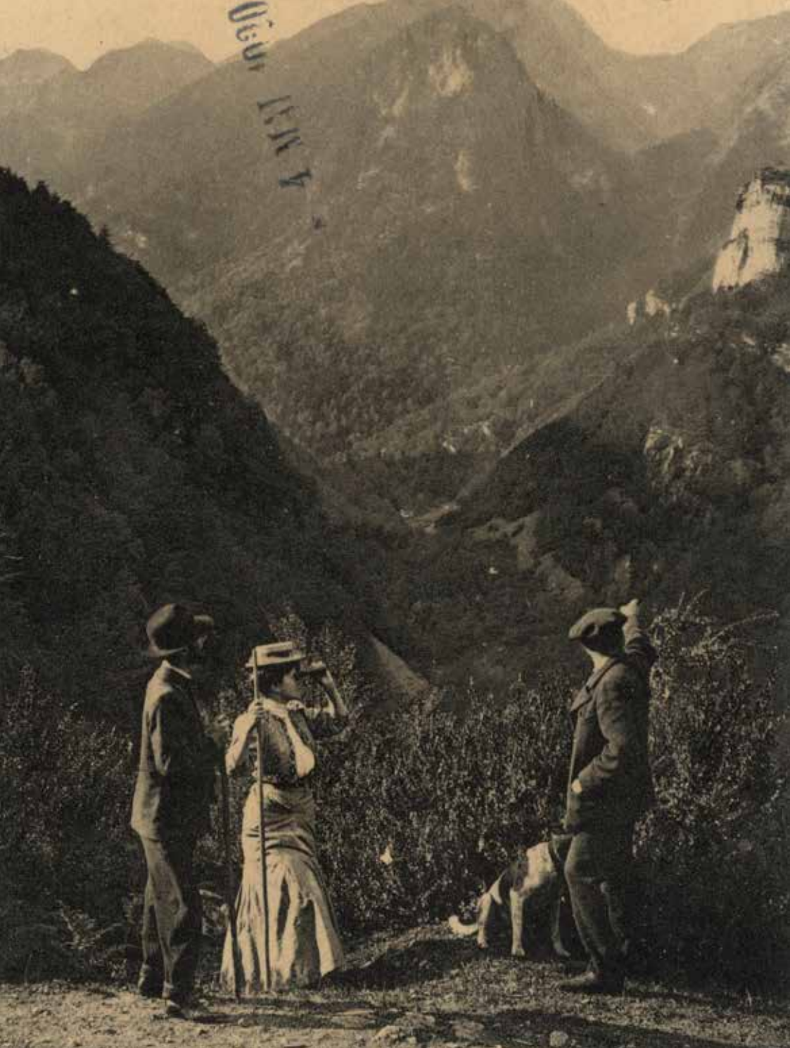
Les Basses-Pyrénées. 406. Eaux-Chaudes : cirque de Gaziès et pic du Midi d'Ossau. Fonds Labouche frères.