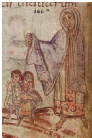
Psautier de Stuttgart, folio 76 r, Abbaye Saint-Germain-des-Prés, 820-830

En partenariat avec l'association des Amis des Archives de la Haute-Garonne.