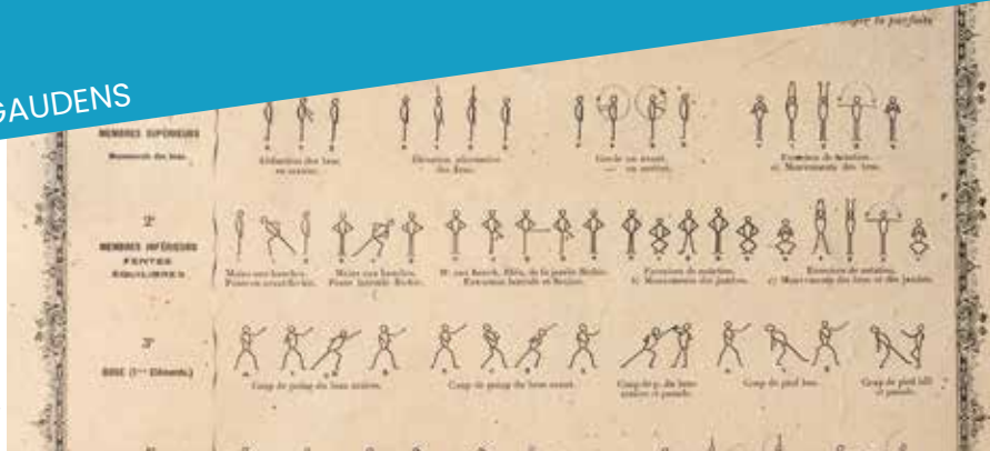
Tableau pédagogique présentant une série d'exercices physiques à afficher en classe.