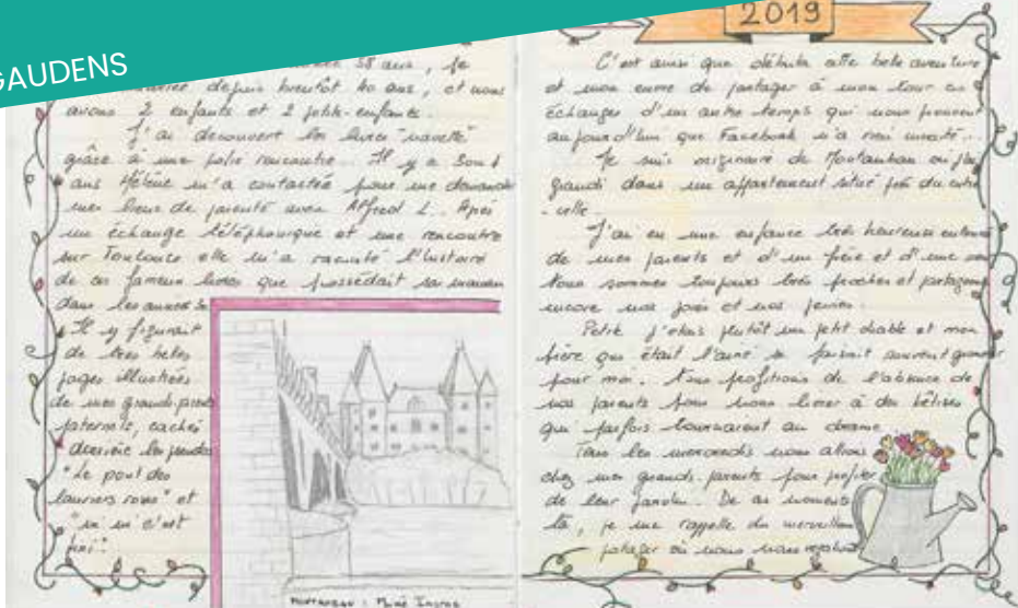
« Souvenirs d'enfance » : livre navette, ADHG, 1 J 1999.